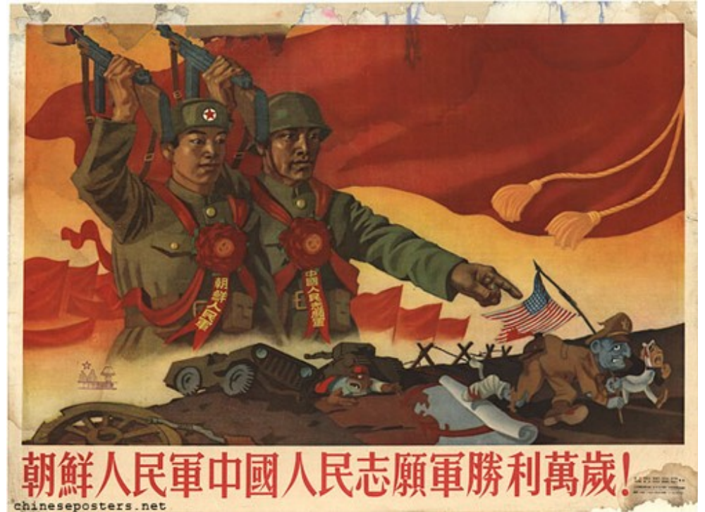
« Vive la victoire de l'Armée Populaire Coréenne et de l'Armée des Volontaires Chinois ! » (1951)