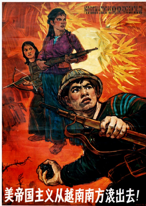
Affiche de 1962 contre l'intervention US au Vietnam : «L'impérialisme américain doit être chassé du Sud Vietnam».