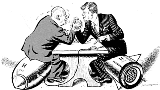
Les Etats-Unis dans une crise : L'affaire des fusées de Cuba en 1962

Les semences des régimes totalitaires sont nourries par la misère et le dénuement. Elles croissent et se multiplient dans le sol aride de la pauvreté et du désordre. Elles atteignent leur développement maximum lorsque l'espoir d'un peuple en une vie meilleure est mort. Cet espoir, il faut que nous le maintenions en vie. Les peuples libres du monde attendent de nous que nous les aidions à sauvegarder leurs libertés.