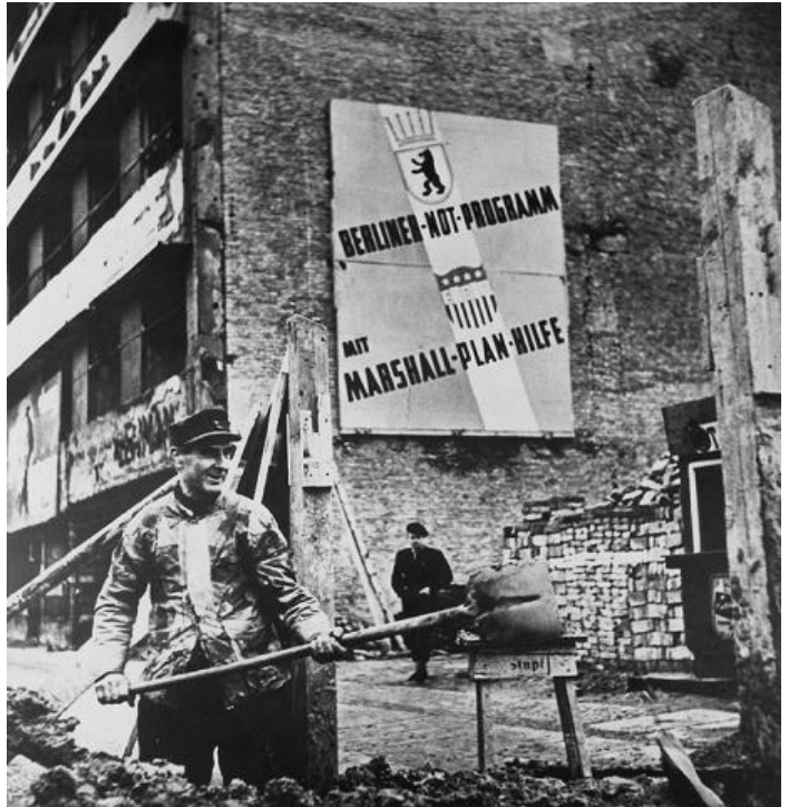
Affiche en faveur du plan Marshall apposée dans un quartier en ruine de Berlin ouest en 1950