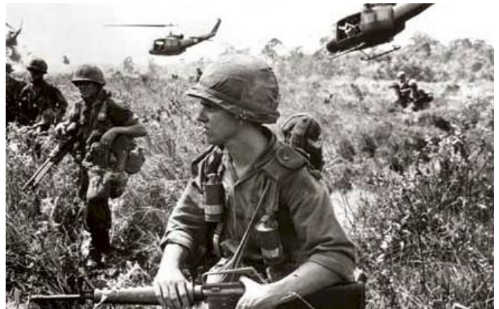
Les Etats-Unis dans une guerre : le Vietnam