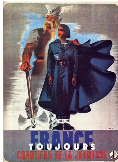
Affiche à la gloire de la France