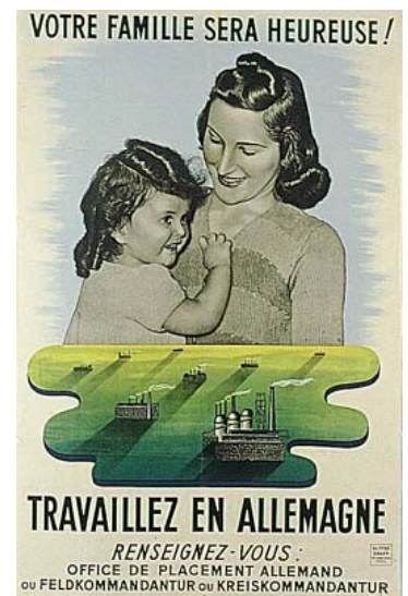
Affiche incitant à aller travailler en Allemagne