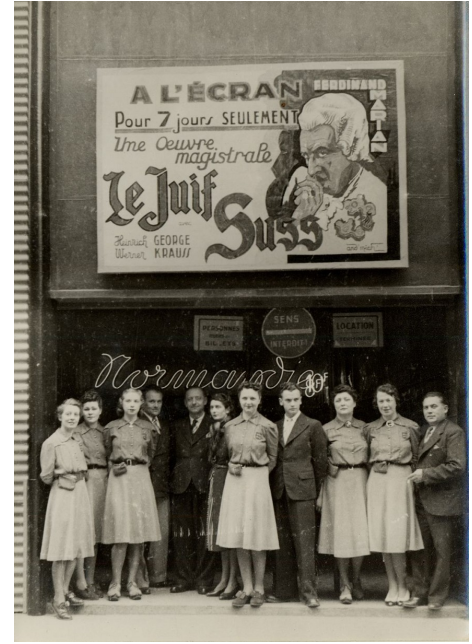
Le Juif Süss, un film nazi violemment antisémite projeté en France

A Paris, la presse collaborationniste déverse des torrents de haine antisémite :