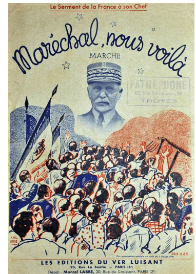
L'édition au service du maréchal