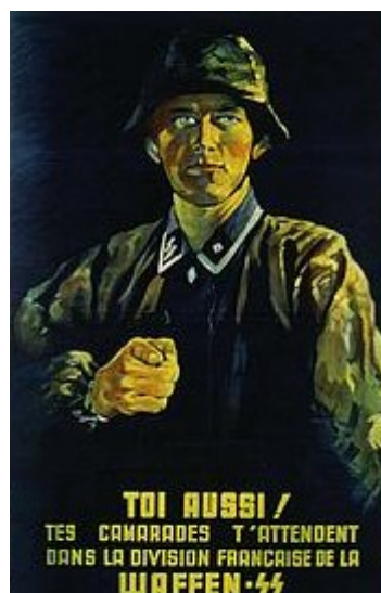
Affiche de recrutement pour la SS