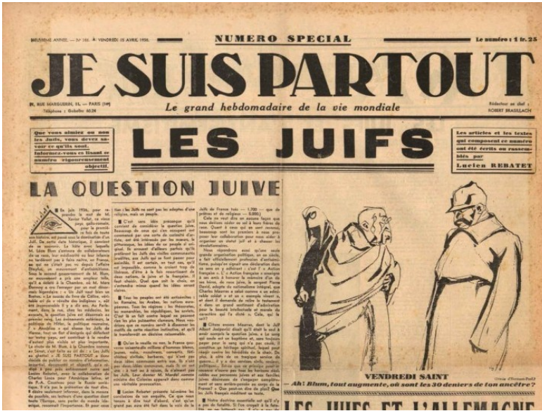
Je suis partout, le principal hebdomadaire collaborationniste et antisémite français pendant la guerre