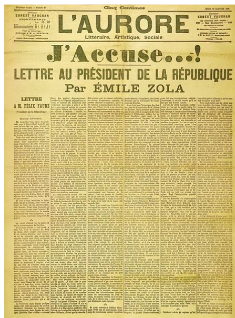
J'accuse...! d'Emile Zola à la Une de l'Aurore , 13 janvier 1898