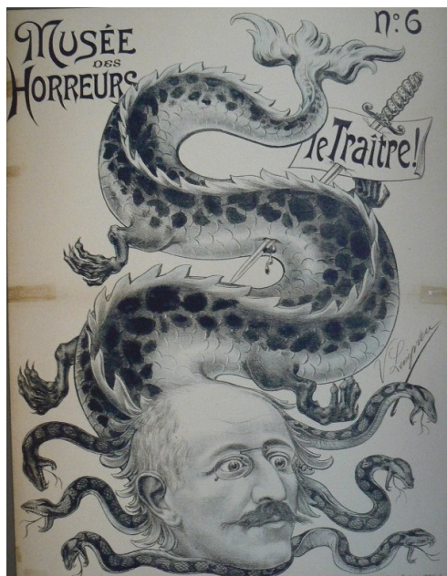
Caricature d'Alfred Dreyfus, vers 1896, musée des Invalides, Paris