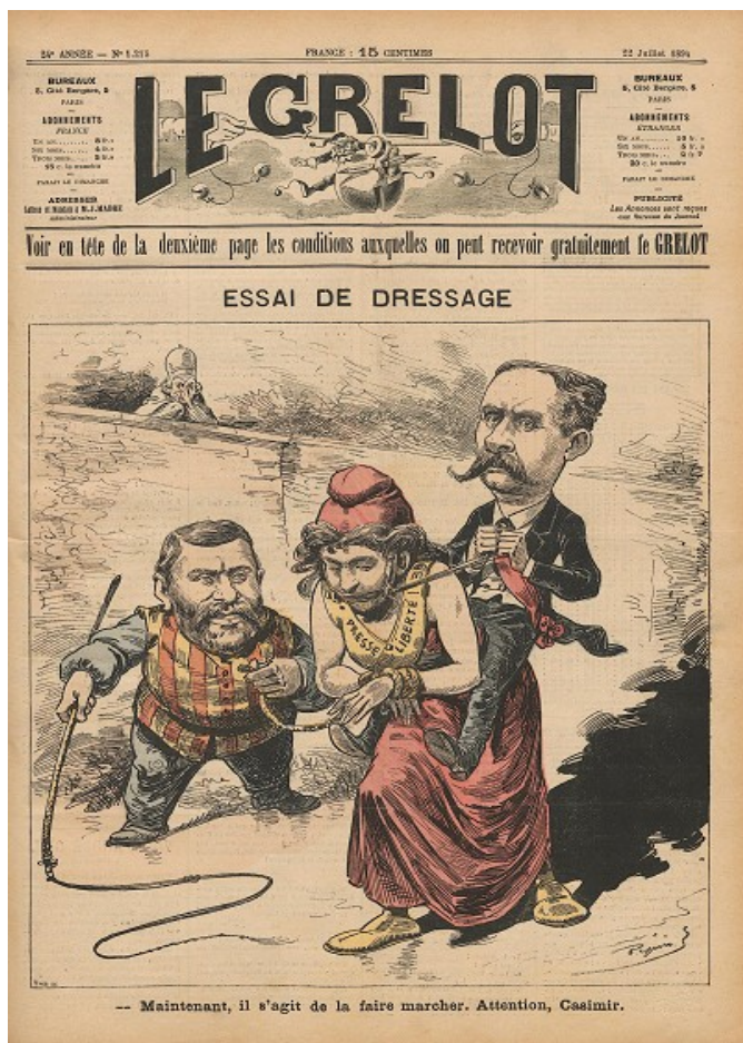
La troisième loi scélérate vues par Le Grelot , le 22 juillet 1894